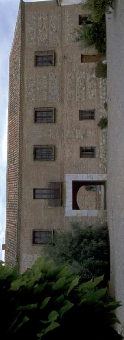
Fontanar. Casa Cartuja

Desde Yunquera de Henares podemos tomar dirección a Guadalajara a través de Fontanar donde cabe destacar la Casa Cartuja. Levantada por los Monjes Cartujos del Monasterio de Sta. María de El Paular, a finales del siglo XV, reconstruida en el siglo XVIII, buen ejemplo de arquitectura barroca castellana, con predominio del ladrillo. No hay que olvidar la Ermita "Virgen de la Soledad", pequeña construcción del siglo XVII.