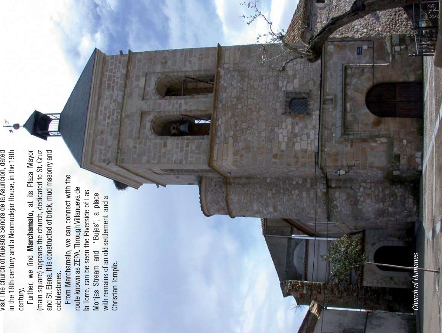
Church of Humanes

On our way, we arrive in Tórtola de Henares where is possible to