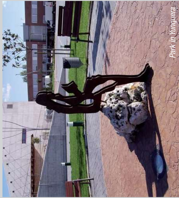
Park in Yunquera

From Marchamalo, we can connect with the route known as ZEPA. Through Villanueva de la Torre, can be seen the Riverside of Las Monjas Stream and "Bujes", a place with remains of an old settlement and a Christian Temple.