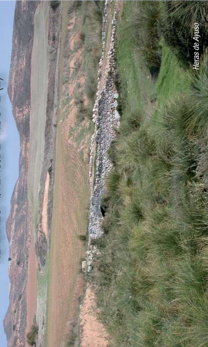
Heras de Ayuso

visit The church of Nuestra Señora de la Asunción, dated in the 18th century and a Neomudejar House, in the 19th century.