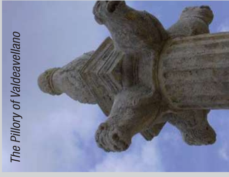
The Pillory of Valdeavellano

From this point, we can link with Torija , the place where our route ends and have a rest to begin a new route that takes us to Middle Ages through Hita and its surrounding area.