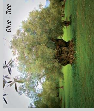
Olive - Tree