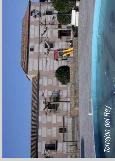
Torrejón del Rey