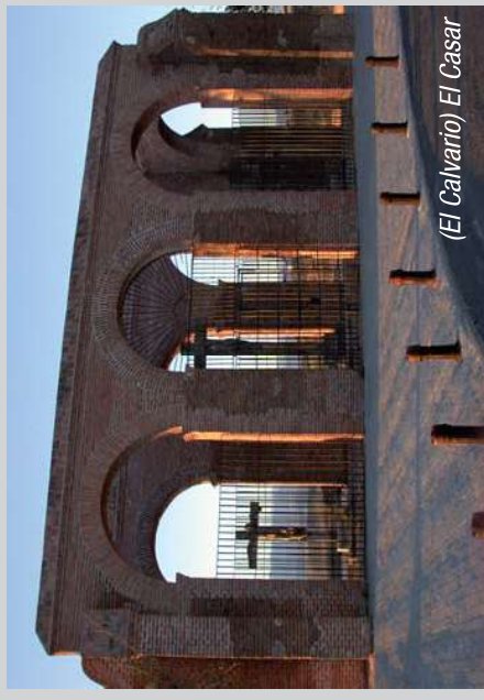
(El Calvario) El Casar

Desde aquí podremos enlazar con la ruta conocida como de la ZEPA donde podremos visitar dos localidades: Quer en donde podremos ver Iglesia Parroquial, del siglo XVI. Y su Ermita de la Misericordia, obra del siglo XVII. Y Villanueva de la Torre donde podremos disfrutar de la zona ZEPA y desde donde podremos enlazar con la Ruta conocida como de la Vega del Henares a través de Marchamalo .