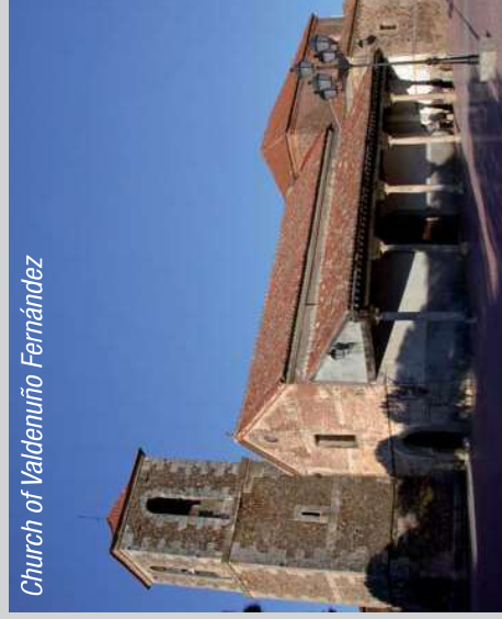
Church of Valdenuño Fernández

From this point we can connect with the route named ZEPA, and go to two localities: Quer , and its Parish Church, (16th century). The Hermitage of La Misericordia, a work of the 17th century and Villanueva de la Torre , a place to enjoy the ZEPA area and with the option to connect with the route known as Henares Riverside Route through Marchamalo .