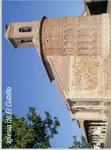
Iglesia de El Cubillo

El conjunto urbano presenta una arquitectura popular construida en aparejo toledano, algunas buenas rejías y escudos.