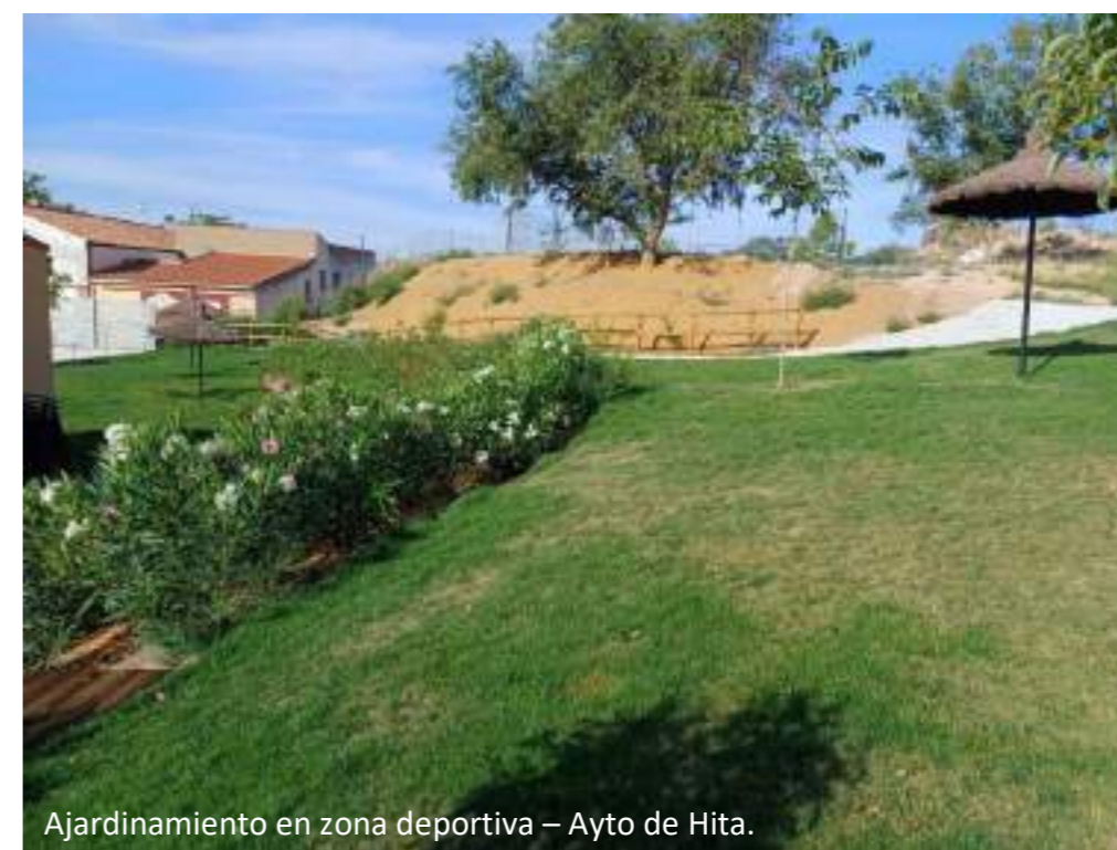
Ajardinamiento en zona deportiva – Ayto de Hita.