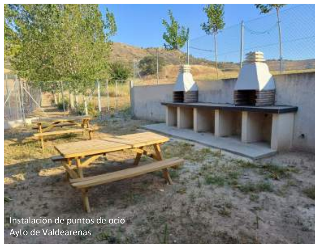
Instalación de puntos de ocio Ayto de Valdearenas