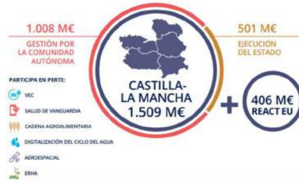
RESUELTAS +150 CONVOCATORIAS DEL PLAN DE RECUPERACIÓN