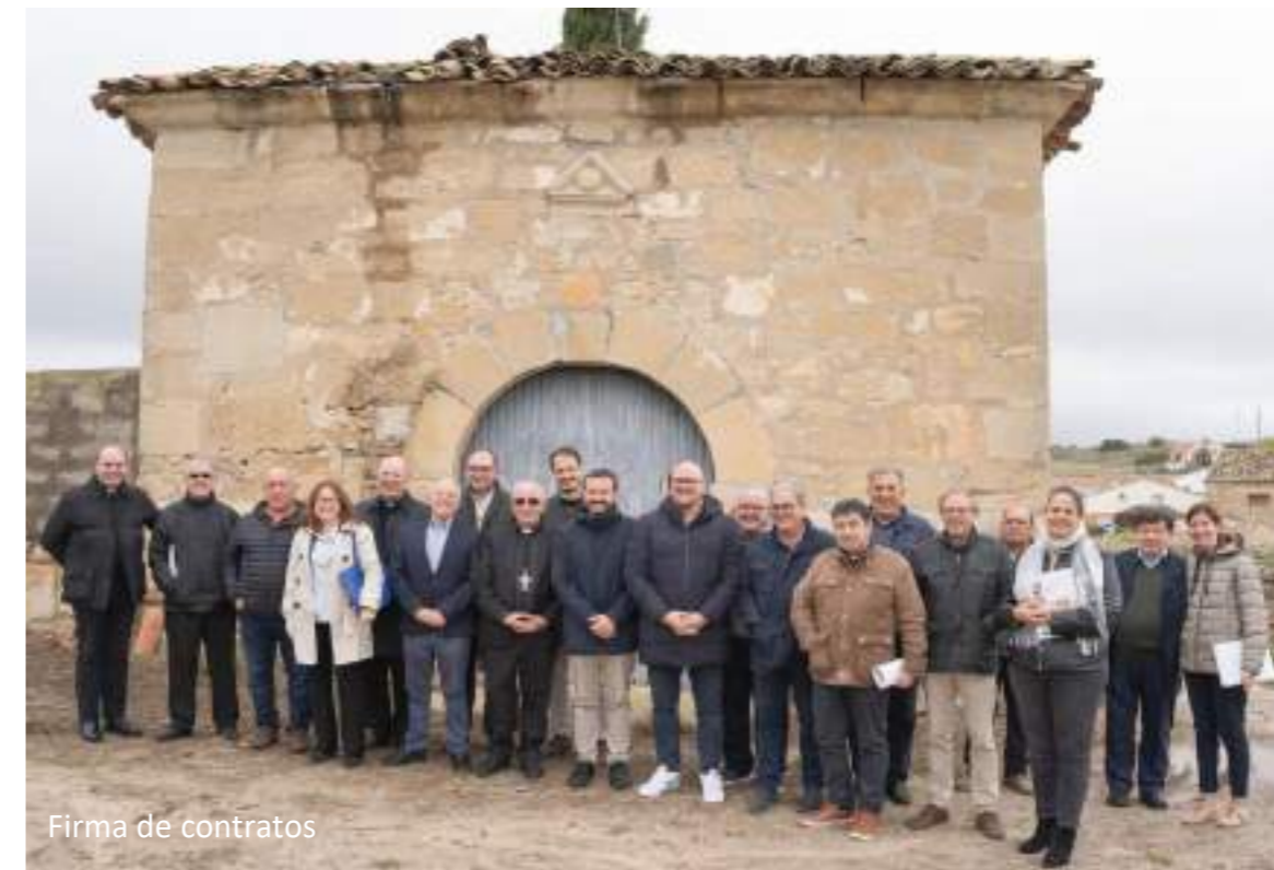
Firma de contratos