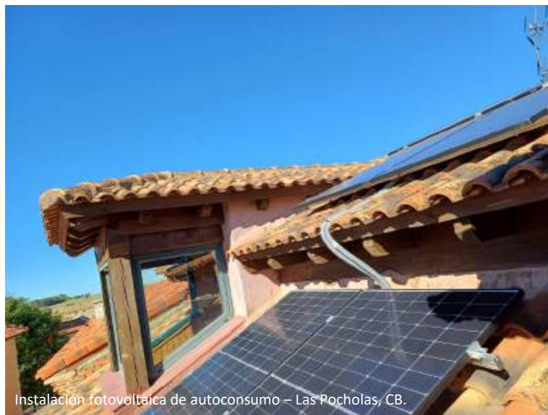
Instalación fotovoltaica de autoconsumo – Las Pocholas, CB.