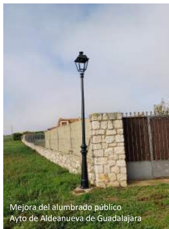
Mejora del alumbrado público Ayto de Aldeanueva de Guadalajara