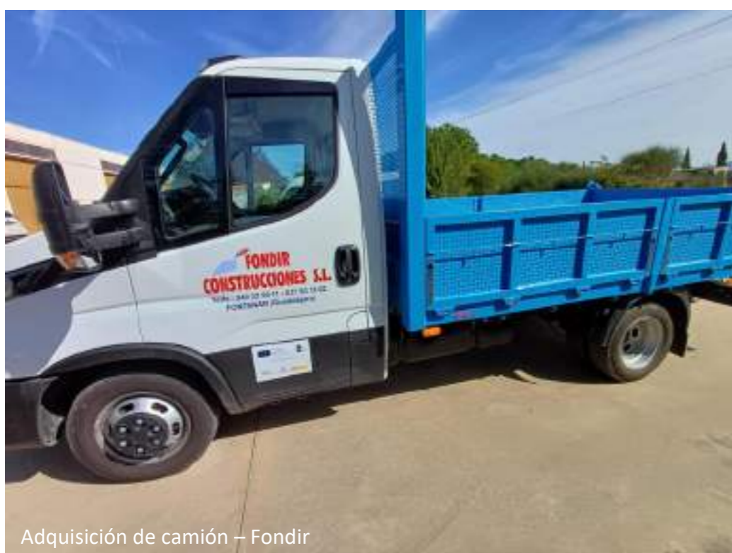
Adquisición de camión – Fondir