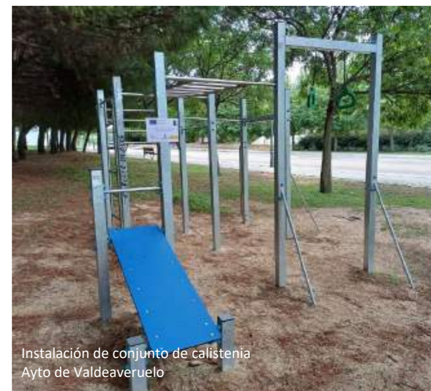
Instalación de conjunto de calistenia Ayto de Valdeaveruelo