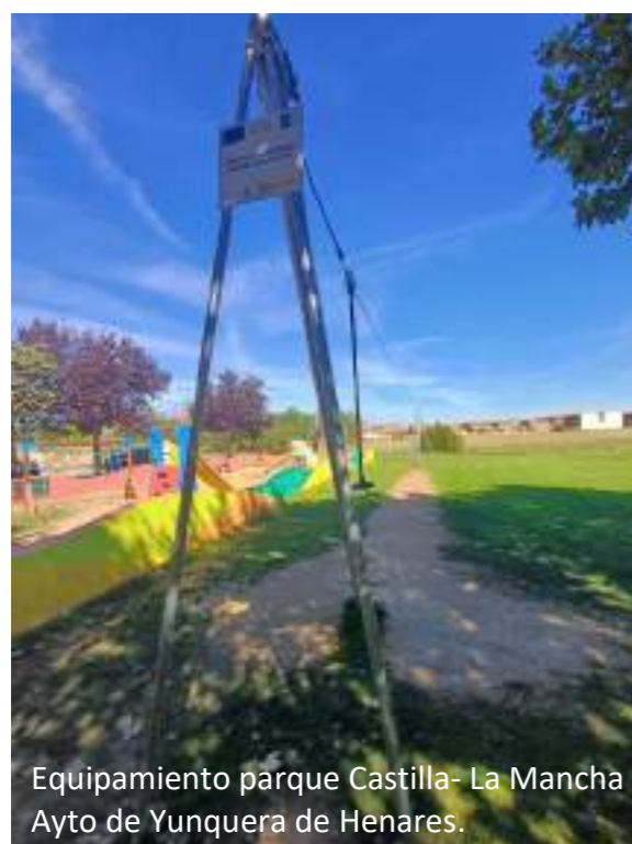
Equipamiento parque Castilla- La Mancha Ayto de Yunquera de Henares.