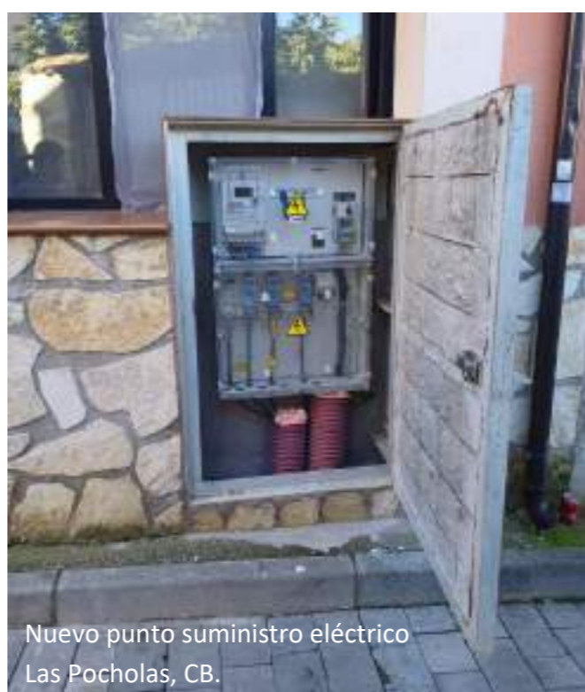
Nuevo punto suministro eléctrico Las Pocholas, CB.