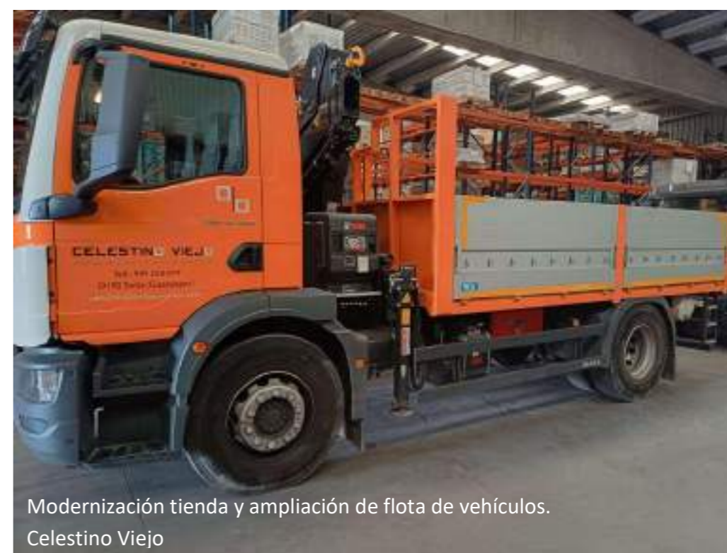
Modernización tienda y ampliación de flota de vehículos. Celestino Viejo