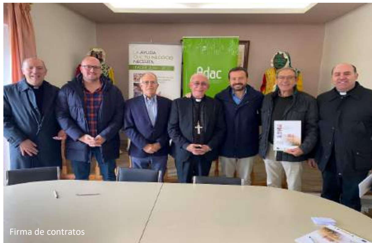
Firma de contratos