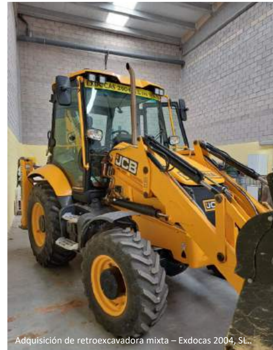
Adquisición de retroexcavadora mixta – Exdocas 2004, SL..