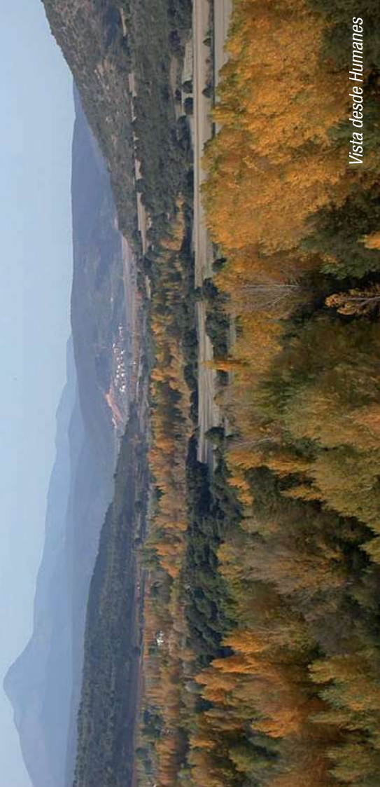
Vista desde Humanes

Esta ruta parte de Yunquera de Henares , visitando la Iglesia Parroquial de San Pedro (Siglo XVI) donde podemos admirar la Torre gótica, y el resto del templo que es renacentista. No hay que olvidar el Palacio de los Mendoza (Siglo XVI), donde podemos apreciar restos de artesonado y frisos platerescos, y la Ermita de la Virgen de la Granja pudiendo disfrutar de su área recreativa.