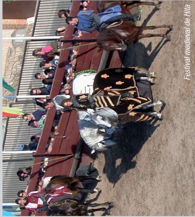
Festival medieval de Hita